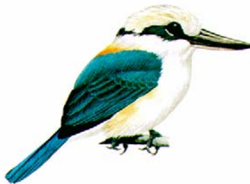
Pahi - ( Halcyon godeffroyi )