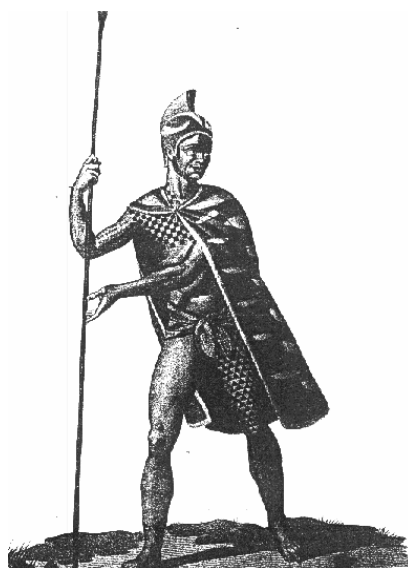
Figure 2: jeune chef Hawaïien portant une cape et une coiffe confectionnées en plumes jaunes et rouges, les plumes jaunes provenant des 'O'o (in Holt 1985).

été perpétuée plus tard par les écrivains" dont R. Lesson lui-même. Dans une note de bas de page (p. 106), ces auteurs rajoutent que l'erreur a été aussi commise par William Ellis qui écrit dans la narration de son voyage "que les indigènes avaient une sorte d'attrape-mouche fait d'une poignée de plumes fixées au bout d'une fine pièce de bois poli, généralement confectionné avec des plumes de coqs, parfois en plumes d'oiseaux de paradis pour les personnes distinguées ou appartenant à un oiseau noir et jaune appelé mo-ho ".