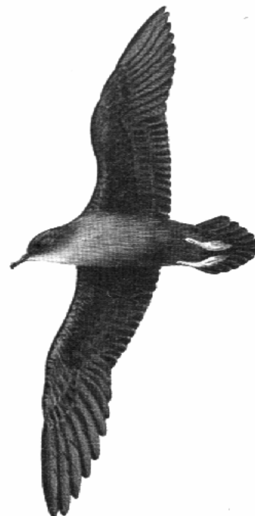
Puffin du Pacifique - Puffinus pacificus