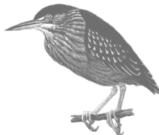
Héron vert ( Butorides striatus )