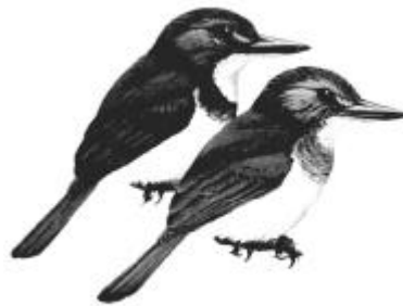
Martin-chasseur vénére Todirhamphus veneratus