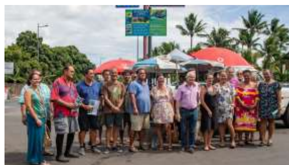
Signature du Pacte entre la SOP et les communes de Punaauia et de Paea et inauguration du Panneau d'information de Punaauia

La SOP tient remercier tous ces participants ainsi que les financeurs de ce programme (voir ci-dessous ainsi que l'ASL Te Maru ATa), les 18 personnes qui ont eu la gentillesse de parrainer un Monarque.